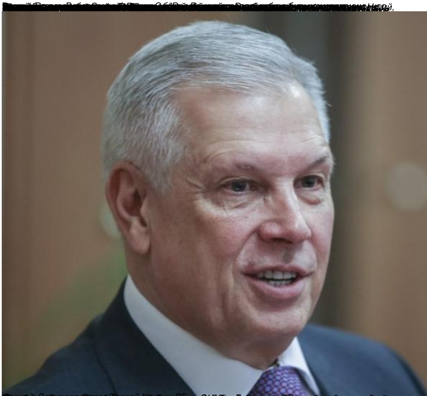
Сергей Наровков, вице-президент «Сбербанка России» и глава Россельхознадзора