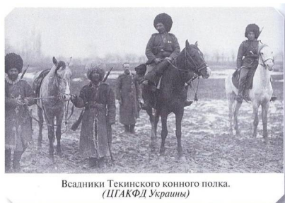
Всадники Текинского конного полка.

десятый, за первые два месяца войны получили Георгиевские кресты. Туркменская конница стала настоящим кошмаром для противника и гордостью для своего командования.