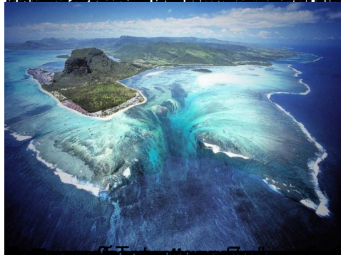
3. Затонувший город - Памли-Батон, Гавайи