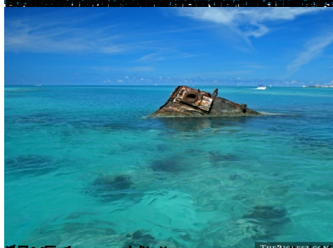
5. Затонувший город - Памли-Батон, Гавайи