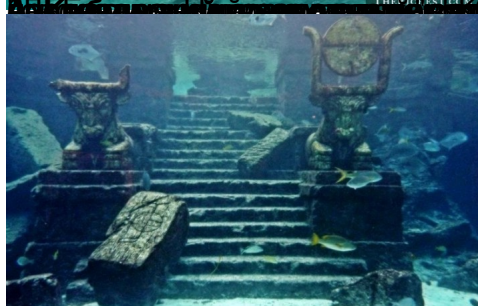
6. Затонувший город - Памли-Батон, Гавайи