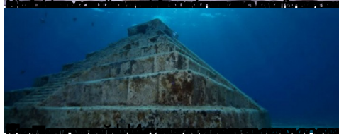
2. Затонувший город - Памли-Батон, Гавайи