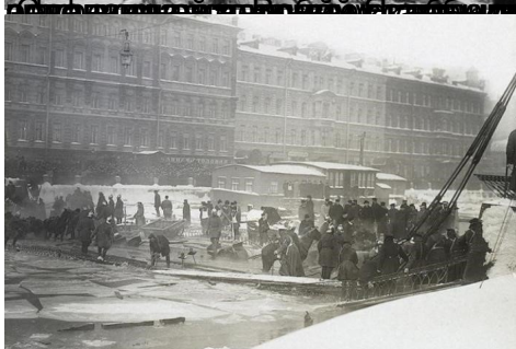
Вид с моста на Петропавловскую крепость. Фотография 1860-х годов.