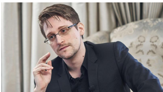
Бывший агент АНБ Эдвард Сноуден

Разумеется, всё это пока лишь догадки. Тот же Alphonso вроде бы играет по правилам и старается не нарушать личного пространства пользователей без разрешения. Впрочем, и он не совсем чист на руку — к примеру, представители компании уверяли граждан, что алгоритм не используется в приложениях для детей. Это оказалось ложью — его следы были найдены в развивающих играх вроде Teeth Fixed. Если они запросто смогли переступить эту черту, да ещё и соврать клиентам в глаза, — кто знает, на что ещё способна Alphonso и ей подобные? Кто-то скажет, что это просто паранойя. Но как говаривал Курт Кобейн, «если ты — параноик, ещё не значит, что за тобой не следят». Так-то.